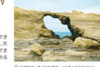
① 三崎町城ヶ島(「白秋碑前」バス停より徒歩15分)

<ハイキングコースについて> 城ヶ島公園→ウミウズ展望台→馬の背洞門(徒歩15分) 城ヶ島灯台→海岸線沿い(徒歩30分)