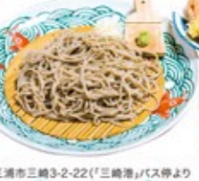
① 三浦市三崎3-2-22(「三崎港」バス停より徒歩2分) ② 046-884-8570 ③ 11:30~15:00、17:00~21:30 ④ 火曜

築100年を超える建物をリノベーションしており、店内は重厚な雰囲気。蕎麦は、海南神社の「御神水」を使用し、毎日手打ちを行なっている。トマトやズッキーニ、ナスなどの夏野菜の天ぷらのほか、栄養価の高い夏野菜・明日葉(あしたば)や、三崎港で採れたアカモク(※写真左)も美味。