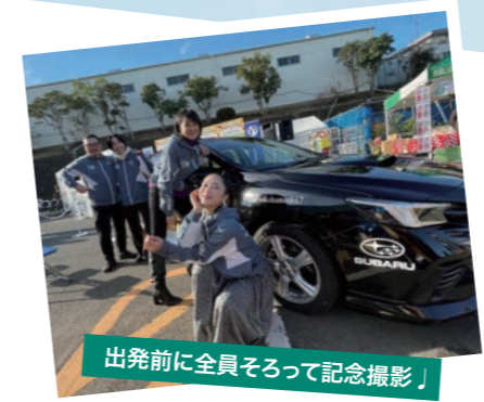
出発前に全員そろって記念撮影!