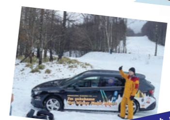
神奈川から飛び出して、県外のスキー場にも行きました!