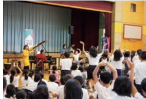
小学校で開催されたラテン・コンサート。大盛り上がりでした！