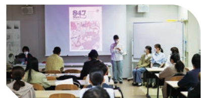
オリジナルのFヨコステッカーを複数作成してデザインに落とし込むことで、今回の「イ中間」というコンセプトを表現しました!

最終プレゼンの様子。フリーマガジンの制作スタッフから、1作品ずつ講評もありました