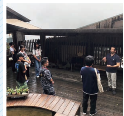
「NARAYA CAFE」では足湯に入ったり、カフェを楽しみました