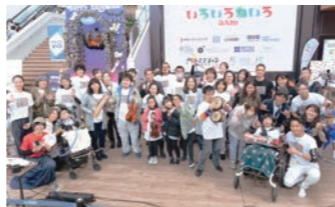
いろいろねいるJAMでの記念撮影の様子