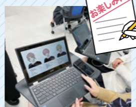
パソコンを使って、ペルソナ設定作り。大人顔負けのクオリティ!

「エフヨコラボ」とは、FMヨコハマがラジオの既成概念にとらわれず、新しい企画やアイデアにチャレンジするプロジェクト。「エフヨコ学校に行く!」はその活動の一環です。