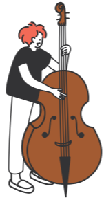
音楽のまち・かわさき