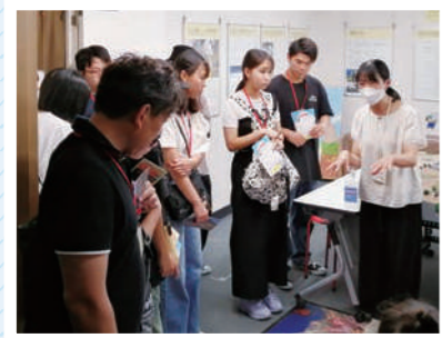
大涌谷では、黒たまごの試食や、ジオパークの見学などを行いました!