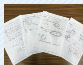
話し合いを進めながら、内容を手書きでまとめていくグループも