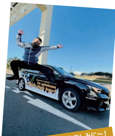
今年のレポートもお楽しみに~!