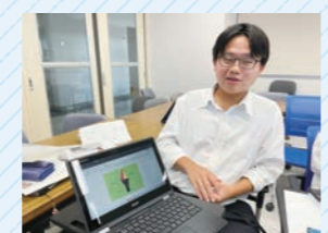
高校生ならではの「柔らかくて斬新なアイデア」を目指しています!