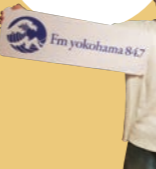
オンエア中、スタジオは2人だけの世界です♡