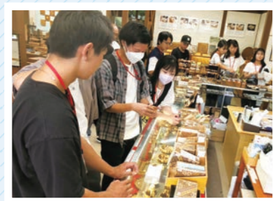
寄木見学では、その技術の高さにみんな興味津々!