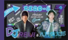
ZERO-8 FRI 22:00~23:30