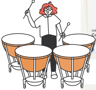
橋本聖子 FMヨコハマDJ